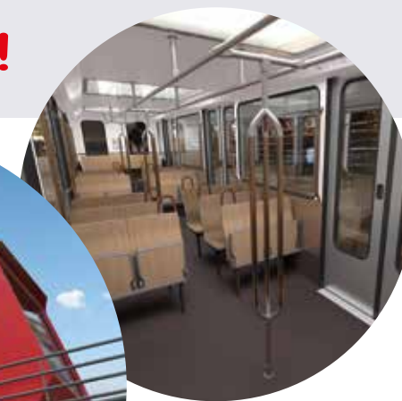
> Le nouveau funiculaire de Saint-Just